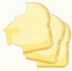
Céréales, grains, pains, pâtes, farine et sucre